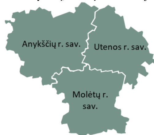
2 paveikslas. Ežerų Lietuva FZ teritorija

2024–2029 m. Ežerų Lietuva FZ strategija bus įgyvendinama Anykščių, Molėtų ir Utenos rajonų savivaldybių teritorijose.